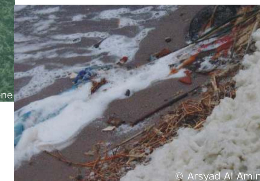
Müll & Schaum im Spülsaum