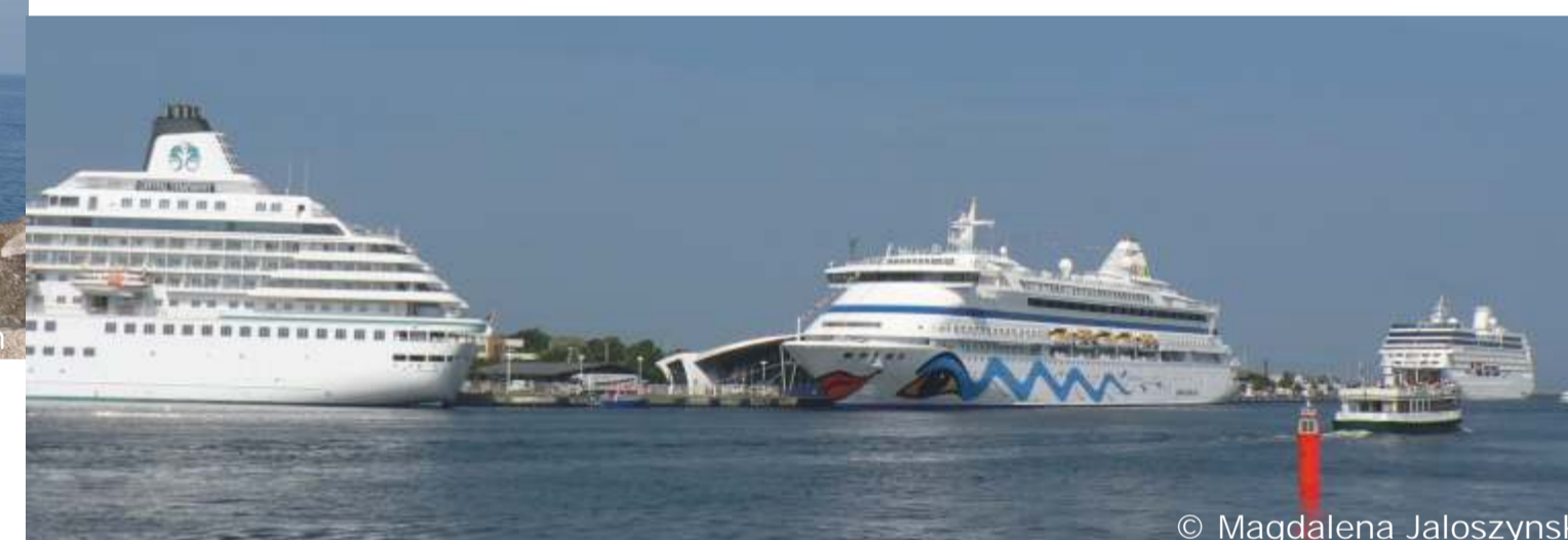
Kreuzfahrer in Warnemünde