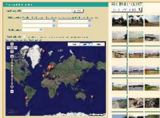
Einstieg in die Küstenfotodatenbank

Kostenlos anmelden, Bilder einstellen, recherchieren & herunterladen: